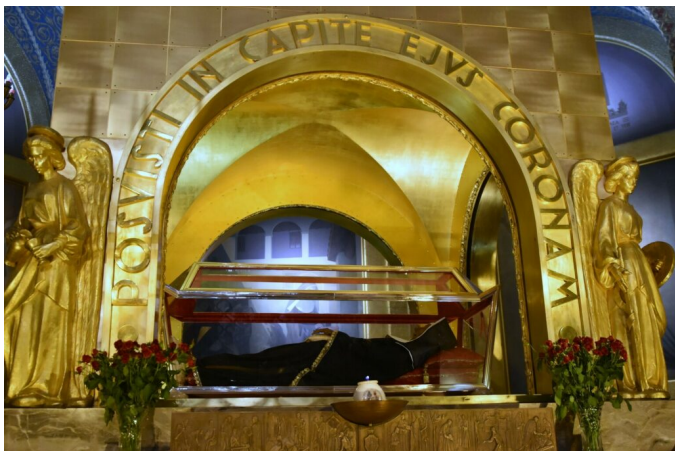
Grób św. Rity w Cascio

nawet jeśli nasze życie przypomina suchy patyk lub zmarznięty ogród, zaufanie Bogu może sprawić, że zakwitnie ono najpiękniejszymi różami.