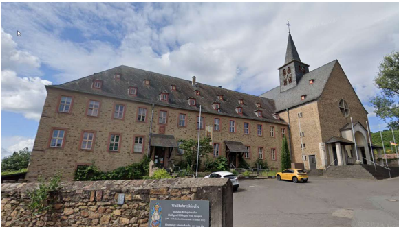
Rudesheim am Rhein, Hesja - Kościół pielgrzymkowy z relikwiami Świętej Hildegardy z Bingen

przechowywane są relikwie świętej. Wspomniano także o roli benedyktynek, które kontynuują jej dzieło.