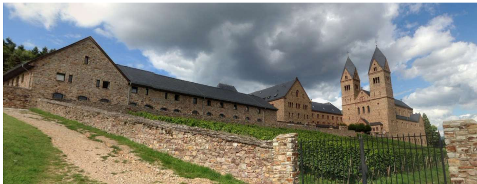
Rudesheim am Rhein, Hesja - Benedyktynskie Opactwo Świętej Hildegardy z Bingen

Następnie uczestnicy zostali przeniesieni do Rupertsbergu, miejsca, gdzie św. Hildegarda